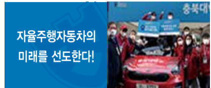
자율주행자동차의 미래를 선도한다!

주행 테스트베드 C-track을 건설하고 있으며 국내 대학 최고 수준의 자율주행 연구 인프라를 통해 우수한 인력양성과 기술 개발에 앞장서고 있다.