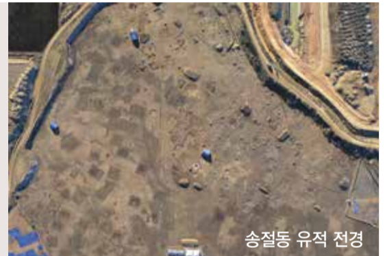
송절동 유적 전경

2005년 개원한 (재)한국선사문화연구원은 문화재 조사·연구 전문기관으로, 유적·유물의 역사적 의미를 학문적으로 체계화하기 위해 노력해 왔습니다.