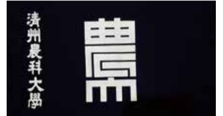
도립 청주농과초급대학(1951~1953)과 도립 청주농과대학(1953~1956) 교기

학교의 상징인 교기를 온전하게 보존하지 못한 점은 70년을 이어온 우리 대학의 역사자료를 홀대하였기 때문이다. 늦었지만, 박물관에서는 졸업앨범 등에 남은 사진을 토대로 유실된 3개의 교기를 복원해서 개교 70주년 행사에 사용한 후 ‘충북대학교역사관’에 전시하고 있다.