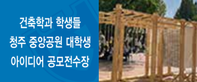
건축학과 학생들, 청주 중앙공원 대학생 아이디어 공모전수상

건축학과 학생들이 2021년 8월 26일에 발표된 ‘2021 청주 중앙공원 대학생 아이디어(파빌리온) 공모전’에서 다수 수상하는 쾌거를 거뒀다. 이번 대회는 2021년 6월 1일까지 치열한 경쟁 끝에 1차 심사를 거쳐 현장설치 대상작을 선정했고, 8월 13일에 현장심사를 거쳐 통과한 3개의 작품이 8월 31일(화)까지 청주 중앙공원에 전시됐다. 건축학과 김주영(석사 2년), 김준희(5학년), 박준혁(4학년), 이고은(4학년), 박종익(4학년) 학생으로 구성된 ‘Ar무말(아무말)’ 팀은 이번 대회에서 최우수상과 특별상을 함께 수상했으며, 상장과 포상금을 받았다. ‘Ar무말(아무말)’ 팀이 제작한 작품은 ‘음유당(소리를 즐기는 마당)’이라는 파빌리온으로 중앙공원에서 일어날 수 있는 다양한 행태와 소리를 담아내기 위한 아이디어로 동시에 재활용품을 사용하여 친환경적인 재료를 통해서 도심의 소리를 담아내고 즐길 수 있는 공간을 만들었다.